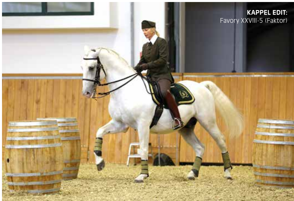
KAPPEL EDIT: Favory XXVIII-5 (Faktor)

Az akadály teljesítése a következő: A lovas az akadálypálya tervében megadott irányból lovagol a hordók közé. Először a jobb kezére kerül meg a hordót, és ráfordul a következő hordóra, miközben a hordók közti képzelt vonalon kézváltást lovagol. Ezután ráfordul az utolsó hordóra, a második és a harmadik hordó közötti képzeletbeli vonalon is lovagol egy kézváltást, és az utolsó hordó körül lovagol