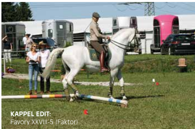
KAPPEL EDIT: Favory XXVIII-5 (Faktor)