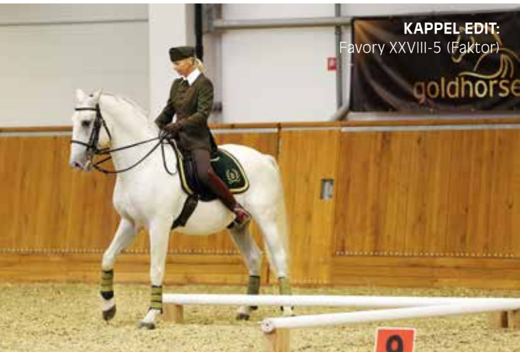
KAPPEL EDIT: Favory XXVIII-5 (Faktor)

kozzon Facebook-csoportunkhoz (Working Equitation Hungary)! Szeretnénk lehetőséget adni a gyakorlásra is. Az Állami Ménesgazdaság Szilvásvárad marócpusztai telepén 2018. február 10-11-én bemutatót, illetve nyílt napot tartunk, amelyre szeretettel várjuk a lovasokat és a nézőket is!